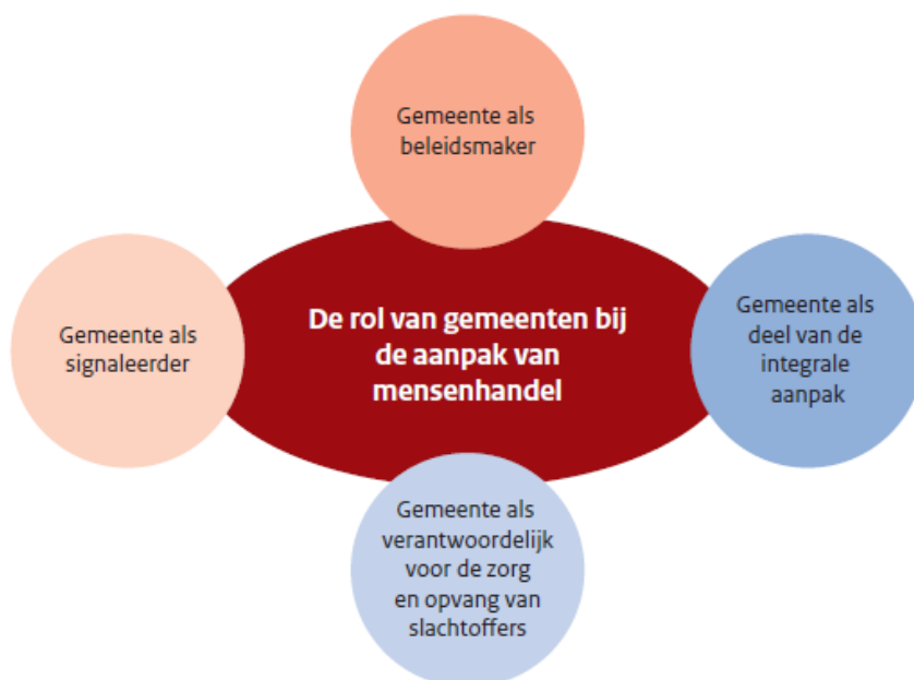
Figuur 2 De rol van gemeenten bij de aanpak van mensenhandel 4

In dit hoofdstuk lichten we elk van deze rollen toe, verkennen we op welke wijze de gemeente Zevenaar hier al invulling aan geeft en formuleren we per rol een doelstelling voor de komende periode.